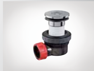
CONJUNTO LAVABO NANO 6.7