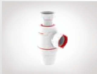
SIFÓN LAVABO, BIDÉ O FREGADERO WIRQUIN NEO