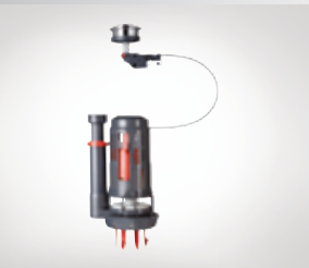
MECANISMO QUICK FIT