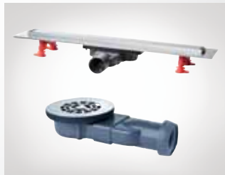
CANALETA Y VÁLVULA DE DUCHA SLIM