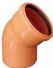
Codo Macho/Hembra 30° con junta. Color teja